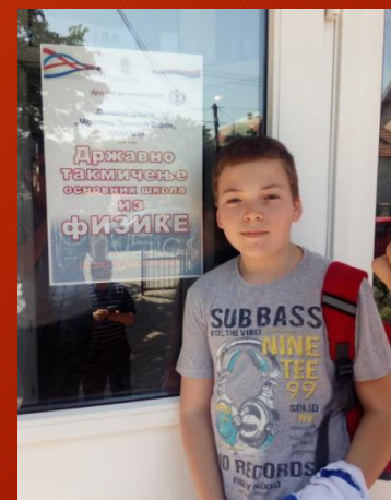
Državno iz fizike